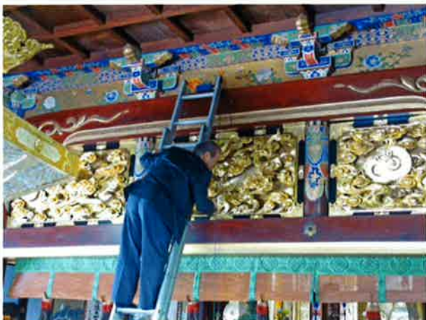
毎熊先生自ら 室内外に機械をセット!